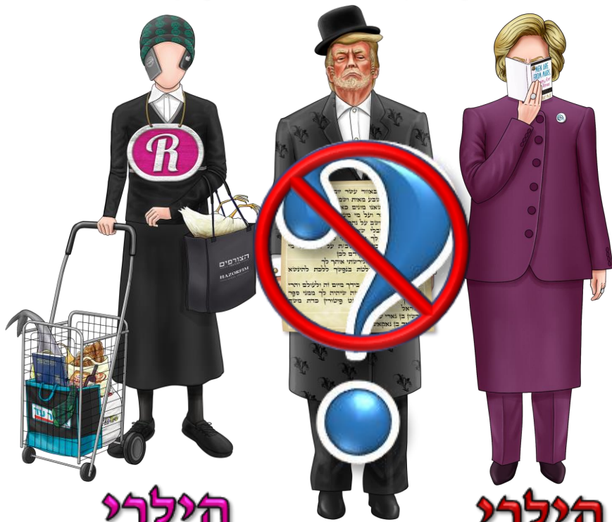
הילרי בת ביל